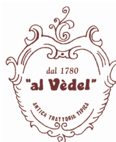
Al Vedel Via Vedole, 68 43052 Colorno PR