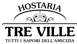
Hostaria Tre Ville Strada Benedetta, 99/a 43122 Parma PR