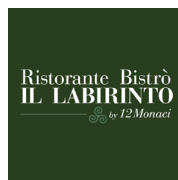
Ristorante Bistrò Il Labirinto Strada Masone, 121 43012 Fontanellato PR