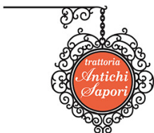
Trattoria Antichi Sapori Strada Montanara, 318 43124 Parma PR